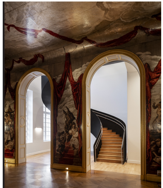
Salle de bal Wendel