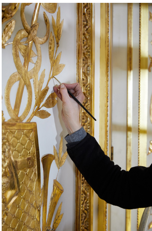
Le salon de compagnie de l'hôtel d'Uzès en cours de restauration