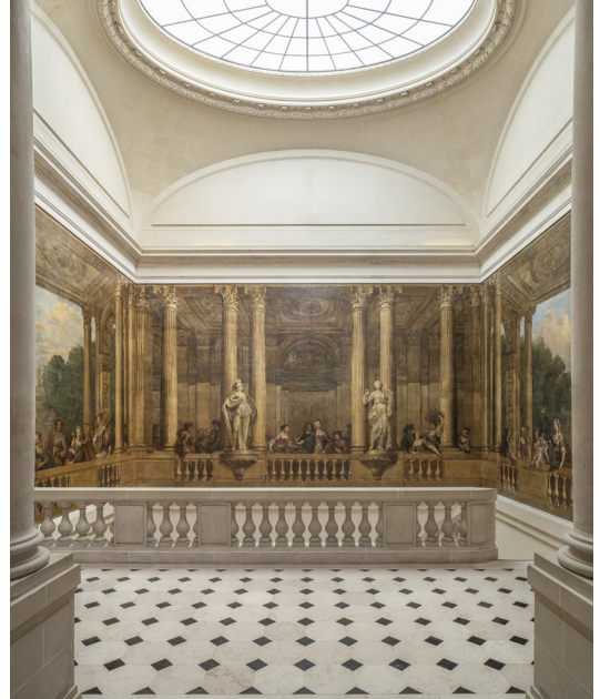
Escalier de Luynes

Pour l'histoire du temps présent (depuis 1977, date de la réforme du statut de Paris), une salle donne la parole à des peintres, photographes, architectes et créateurs, ... qui révèlent la force des expressions, des mutations et des projets à l'œuvre sur le territoire parisien et du Grand Paris.