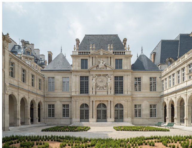
Cour des Drapiers, musée Carnavalet - Histoire de Paris

Grande découverte de cette rénovation : l'une des parties les plus anciennes du bâtiment, au sous-sol de l'Hôtel Carnavalet, est aujourd'hui ouverte au public et dévoile ses espaces voûtés en pierre.