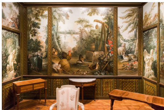
Le salon Demarteau restauré

La totalité des œuvres présentées dans le nouvel accrochage a été restaurée. Plus d'une centaine de conservateurs restaurateurs aux expertises variées (peinture, sculpture, bois, métal, ...) ont participé à cet ambitieux chantier de restauration des collections afin de valoriser cet exceptionnel patrimoine parisien.